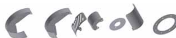
Beskyttelseskomponenter for det nordiske markedet, utviklet og produsert av Bevola.

levering. Denne justeringen gir markedets største besparing for transportøren i dekk-slitasje, drivstoff og reparasjoner. CAAC sparer miljøet og gir mindre slitasje på veiene.