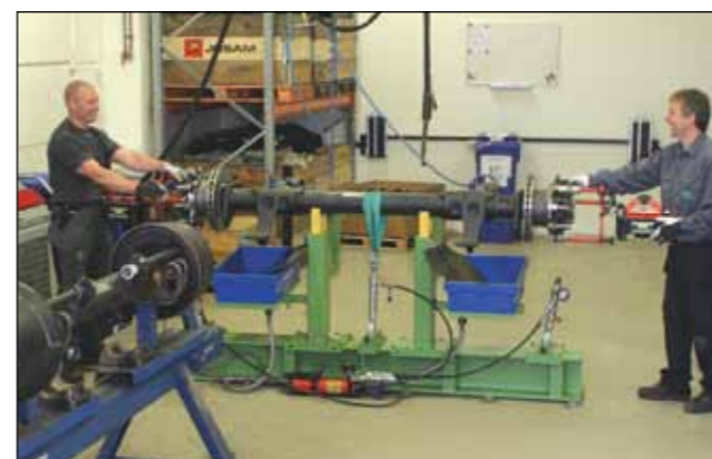
CAAC. Akslejustering med avgjørende fordeler.

Bevola har gjennom mange år opparbeidet seg praktisk og teoretisk erfaring. Denne erfaringen bruker vi aktivt i vår nye CAAC-plattform, som gir våre kunder en stor fordel. CAAC betyr "Computer Axle Adjustment Concept". Gjennom CAAC lasermåler og justeres alle aksler før