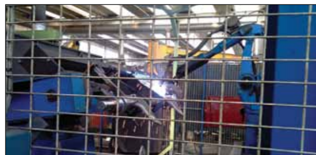
Robotlinje hos Stefen

Etter finanskrisen har Meritor valgt å legge ned sin akselproduksjon i Wales og trekke seg ut av det europeiske markedet for hengeraksler. Men Meritor har i mer enn 25 år fått produsert sine styrbare og spesialtilpassede aksler hos Assali Stefen i Verona Italia. Dette selskapet overtar nå hele Meritors akselproduksjon for det europeiske markedet. Assali Stefens har topp moderne produksjonslokaler, stor fleksibilitet og meget høy kvalitet.